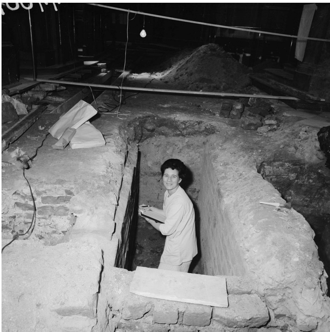
Výzkum hrobky Jindřicha z Lipé v roce 1966.