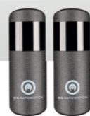
Coppia di fotocellule pz/conf.1