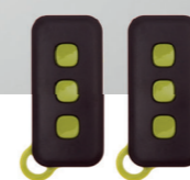
Coppia di radiocomandi 433MHz AM rolling-code pz/conf.1

Universal led flashing light with integrated aerial pc/pack.1