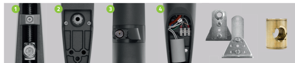
Fermi meccanici Mechanical stops