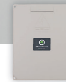
Centrale di comando pz/conf.1

Pair of 433MHz AM radio control rolling-code pc/pack.1