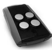
FENIX 4 superheterodynní přijímač pracující na frekvenci 433.92 MHz