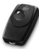
BIO dálkové ovládání, s přesným kódem 40.685 MHz