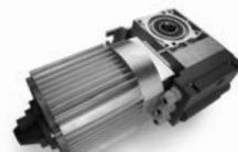
TOM pohon pro průmyslová sekční a rolovací vrata do 750 kg