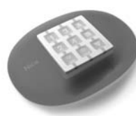
NiceWay dálkové ovládání, 433.92 MHz, provedení zeď, stůl nebo komb.