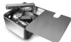
METRO pohon pro otočné brány do velikosti křídla 3,5 m