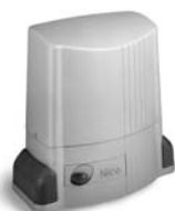
THOR pohon pro posuvné brány do 2200 kg