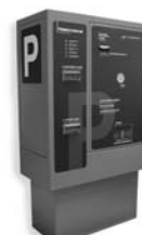
VA 401 platební automat pro výběr parkovného