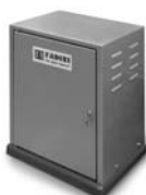
FIBO 400 pohon pro posuvné brány do 4000 kg