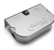
COMBI 740 pohon pro otočné brány do hmotnosti křídla 700 kg