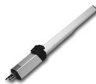
HINDI 880 pohon pro otočné brány do velikosti křídla 6 m