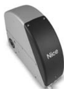
SUMO pohon pro průmyslová sekční vrata do velikosti 35 m 2