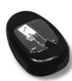
KP 100 snímač bezkontaktních karet s kontrolou vstupů/výstupů