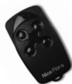
FLOR dálkové ovládání s plovoucím kódem, 433.92 MHz