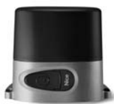
ROBO pohon pro posuvné brány do 600 kg