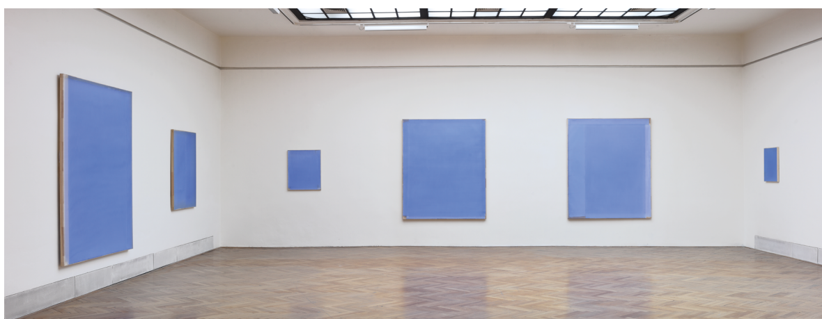
Jaromír Novotný, Ostatní se nemění , 2021, foto: Martin Polák