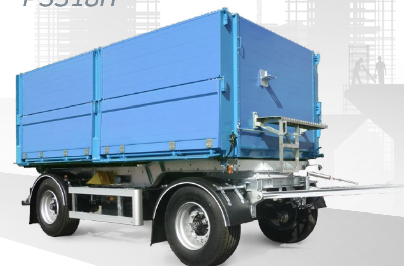
Přívěs sklápěcí PS318H

Sklápěcí návěsy / Sklápěcí točnicové přívěsy / Sklápěcí tandemové přívěsy / Sklápěcí nástavby Panav / Sklápěcí soupravy Panav / Speciální sklápěcí vozidla