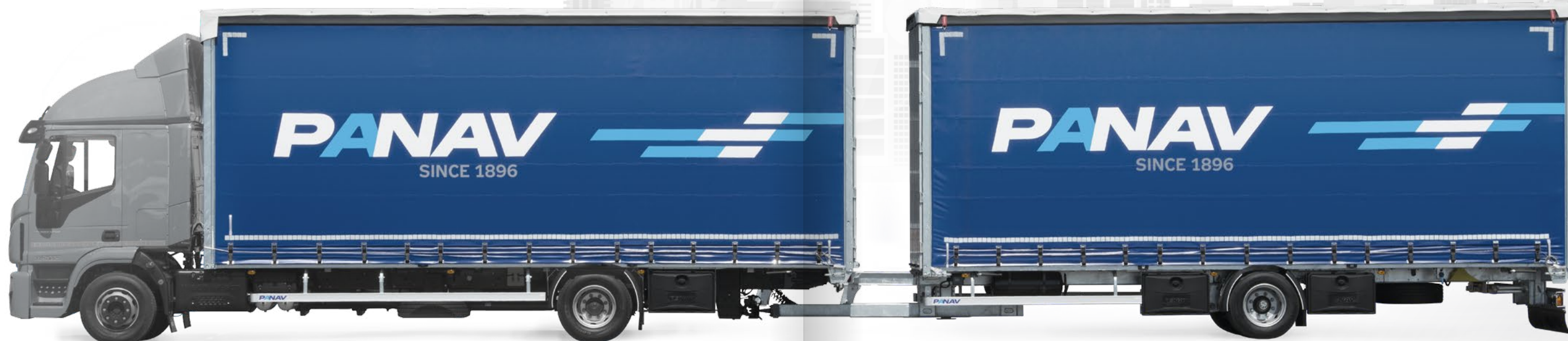
Velkoobjemová souprava ANV + TV010L

Valníkové návěsy / Valníkové točnicové přívěsy / Valníkové tandemové přívěsy / Valníkové nástavby Panav / Valníkové soupravy Panav / Speciální valníková vozidla