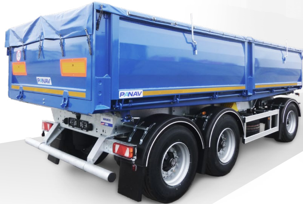
Přívěs sklápěcí PS324H

Sklápěcí návěsy / Sklápěcí točnicové přívěsy / Sklápěcí tandemové přívěsy / Sklápěcí nástavby Panav / Sklápěcí soupravy Panav / Speciální sklápěcí vozidla