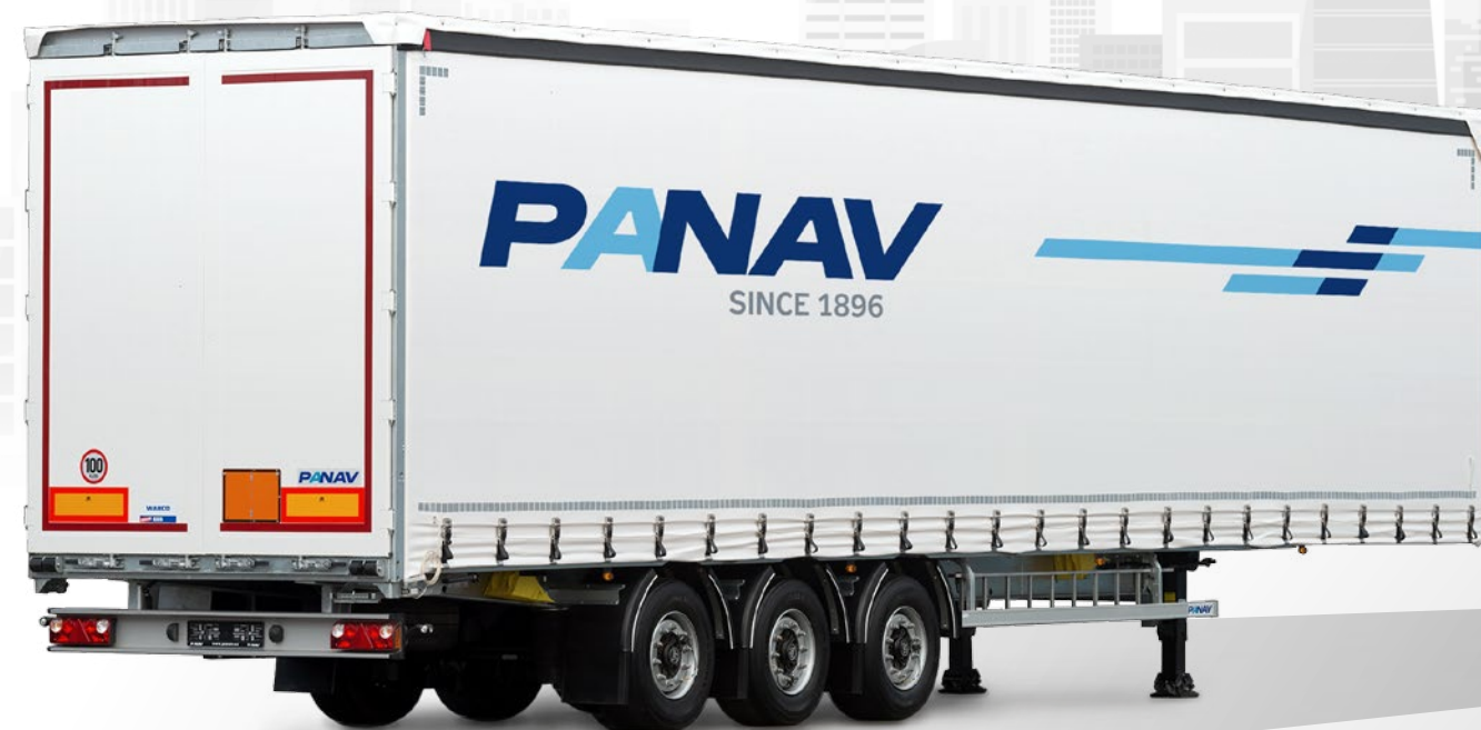
Velkoobjemový valníkový návěs NV035M