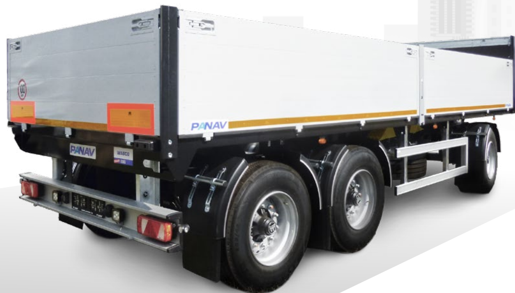
Přívěs valníkový PV024H